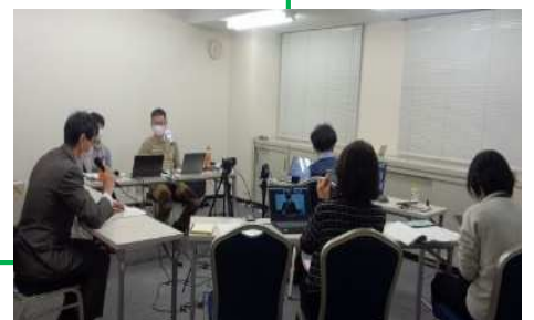
オンライン配信会場