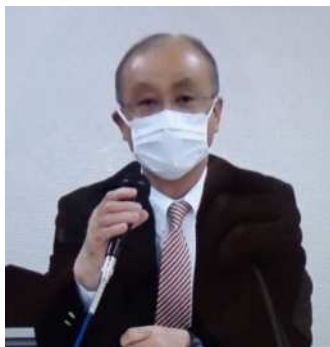
北海道農業公社 在原就農相談課長より ご挨拶

全道から18名の後継者・ 就農研修中の女性達が参加。 事前に参加者より寄せられた 相談内容について、全員に回 答・コメントをいただきました。 参加者一同、感激！！ 時間が足りません・・・。